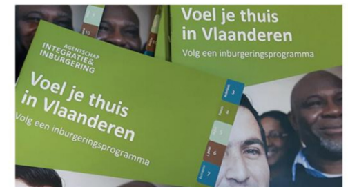
Agentschap Integratie en Inburgering

Ook op de algemene vergadering van ADR-Vlaanderen wordt er dieper ingegaan op dit thema.