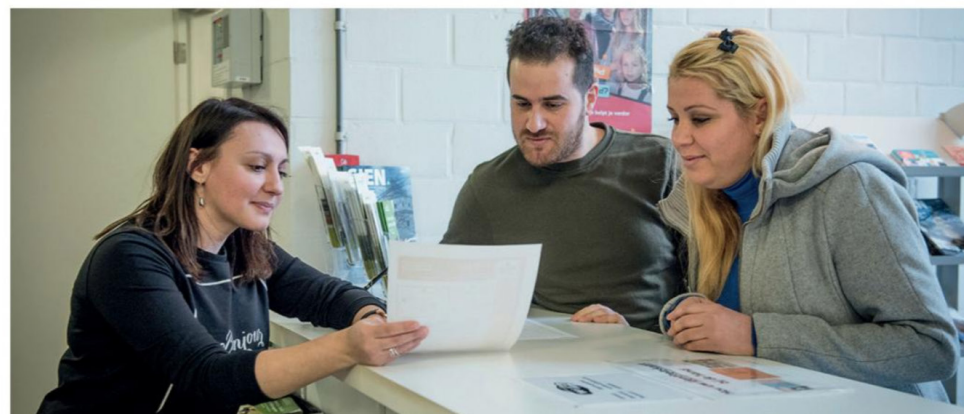
Agentschap Integratie en Inburgering

In 2018 volgden in Vlaanderen 542 personen een cursus Maatschappelijke Oriëntatie in het Roemeens. Dat is een van de 31 talen waarin je de cursus kan volgen. In totaal hebben 12.193 mensen een inburgeringscursus gevolgd.